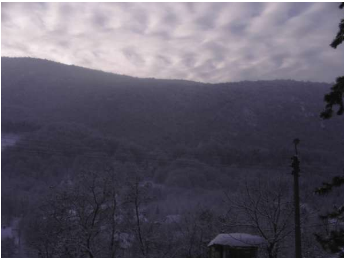
Слика бр. 2 ТОЧАК ВРЕМЕНА У ПРОСТОРУ КОЈИ СЕ ЈАВИО ДАНА 24.12.2012.ГОД, ОКО 15.00 САТИ. СНИМАК САМ СНИМИО НАКОН ИНТЕРВЈУА ТВ СОКОБАЊА, КОЈИ ЈЕ БИО ОКО 14.20 САТИ.(доњи снимак)