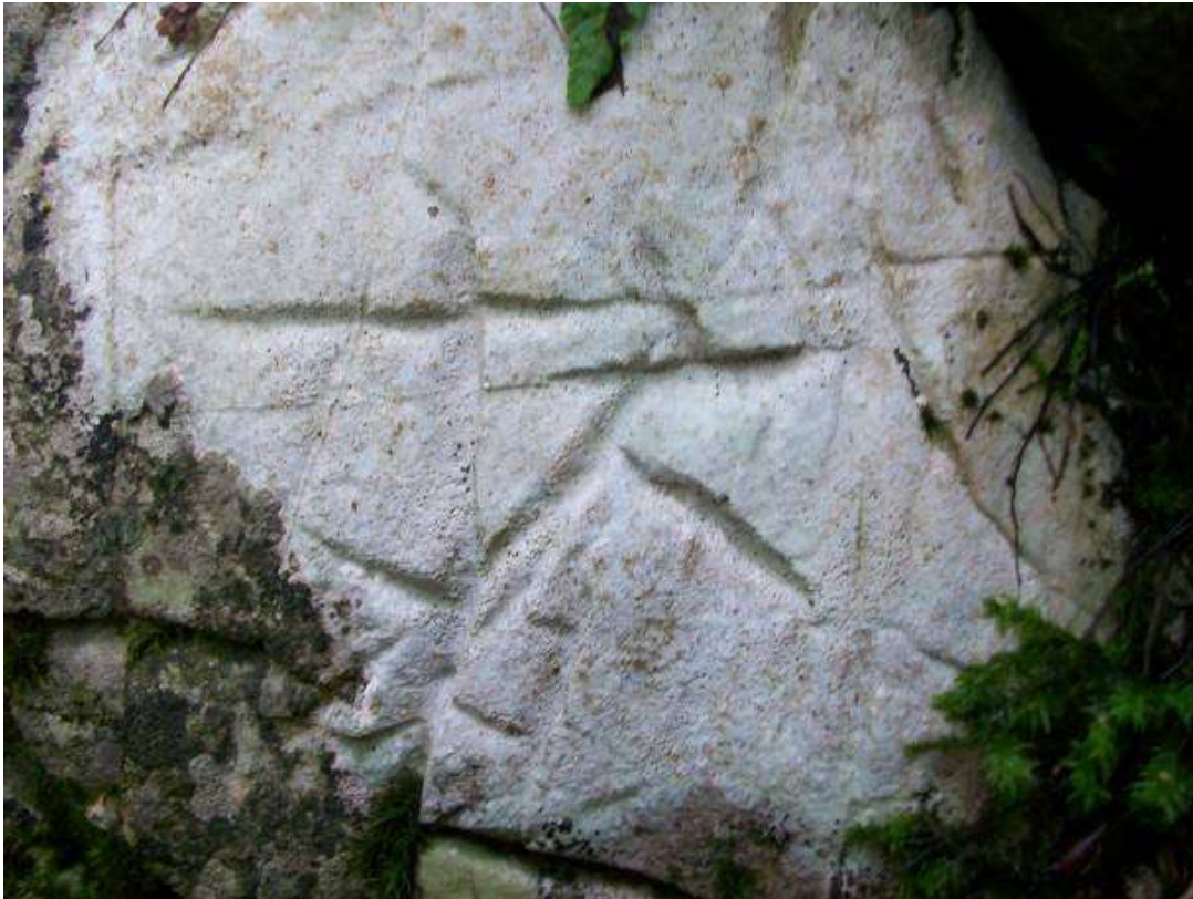
Слика Ртањ – камен намерно резбарен

Гледам поново овај камен са овим цртежима и све ми се чини као да видим две особе раширених руку, једна од њих - друга с лева на десно, јаше нешто или су то њене ноге, или се спрема нешто да узјаше. А ако само мало боље загледате, видећете на првој фигури нешто што личи на два ока и укосо постављеним устима. Ово је по данашњим мерилима апстрактна уметност, али са потпуном ликовношћу. Када то кажем, мислим на осећај потпуног ликовног доживљаја, тј. да је ово једна успешно одсликана сцена у пуном замаху, са енергичним покретима, и са јасним циљем кретања.