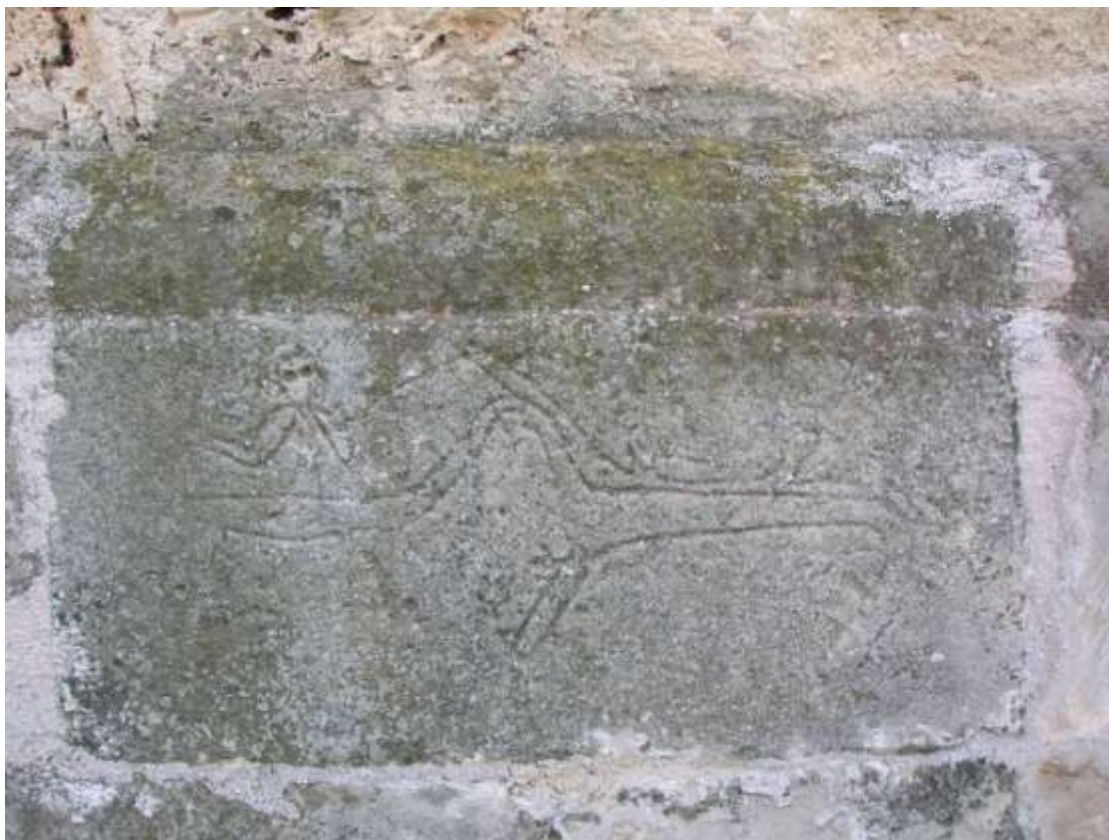
Слика Цртеж у камену који се налази околo Тршке цркве код Жагубице