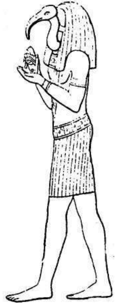
Слика бр.231 Бог

ЈА САМ ИЗ ПОШТОВАЊА ПРЕМА БОГУ НЕБА ХОРУСУ ДАО ИМЕ ‘ХОРУСОВ ЗАРЕЗ’ КОЛИ ЈЕ 64/63