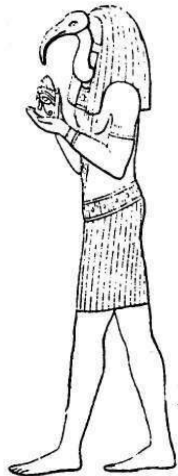
Picture 3. God Thoth

I AM FROM RESPECT for God HORUS OF HEAVEN named "HORUS POINT" THAT IS NUMBER 64/63 .