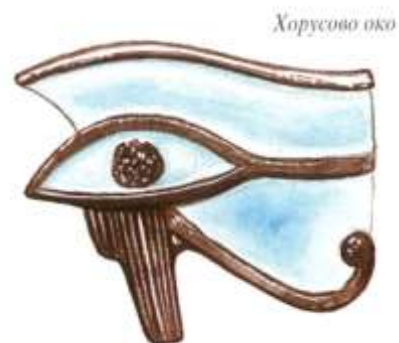
Picture 1 Horus eye

''Uđat '' or ''Uđa,'' as the right eye of Horus Egyptian name, pulled me to think that I have the right to interpret this as a ENTER, BECAUSE IT IS Serbian word ''UDJE'' or '' You get in and she entered''. For really light enters, enters the eye, or Lentils, and transmitted to us the picture you see